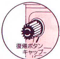
復帰ボタン キャップ